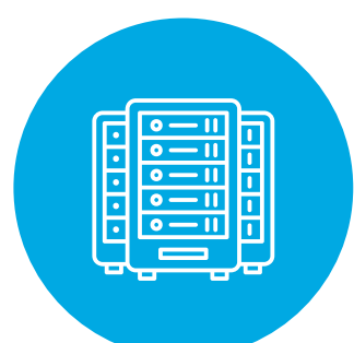
CENTRO DE DATOS